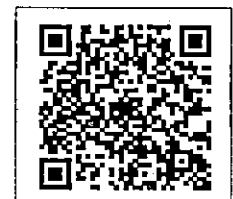
QR-Code เพื่อสอบถามข้อมูล