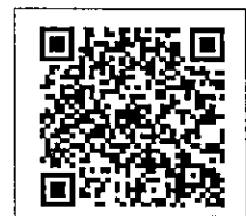
QR-Code เพื่อสอบถามข้อมูล