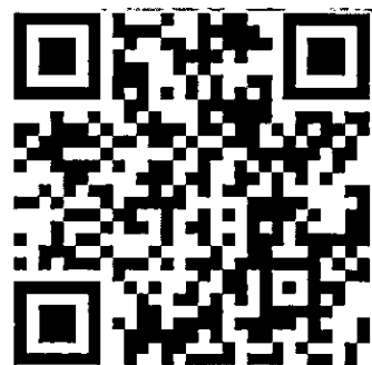
QR Code กรอกใบสมัคร

น้อมนำพระปณิธาน สร้างสรรค์งานวิจัยและนวัตกรรม ให้บริการสุขภาพด้านผิวหนังโดยคำนึงถึงผู้ป่วยและประชาชนเป็นศูนย์กลางมีความรับผิดชอบต่อสังคมและชุมชน สามารถเรียนรู้ด้วยตนเองได้อย่างต่อเนื่องตลอดชีวิต มีสมรรถนะดิจิทัลและสามารถประยุกต์ใช้เทคโนโลยีดิจิทัลได้อย่างเหมาะสม เพื่อแก้ไขปัญหาสาธารณสุขด้านผิวหนังและพัฒนาสุขภาพของประชาชนด้วยความเป็นเลิศเพื่อทุกชีวิต