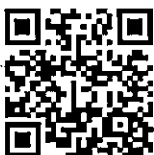
ประกาศรับสมัครฯ

รักษาการคณบดีวิทยาลัยแพทยศาสตร์ศรีสวางควัฒน โรงพยาบาลอุทัยธานี