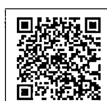
QR-Code เว็บไซต์