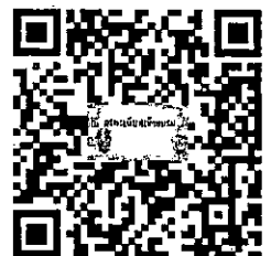
ลงทะเบียนเข้าร่วมอบรม

โทรศัพท์ ๐๔๓๕ ต่อ ๕๑๑๓, ๕๑๒๐ หรือ ๐๔๓-๕๓๕๔-๕๖๓๕ (ในเวลาราชการ)